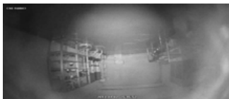
<Stoffige en vette koepel>